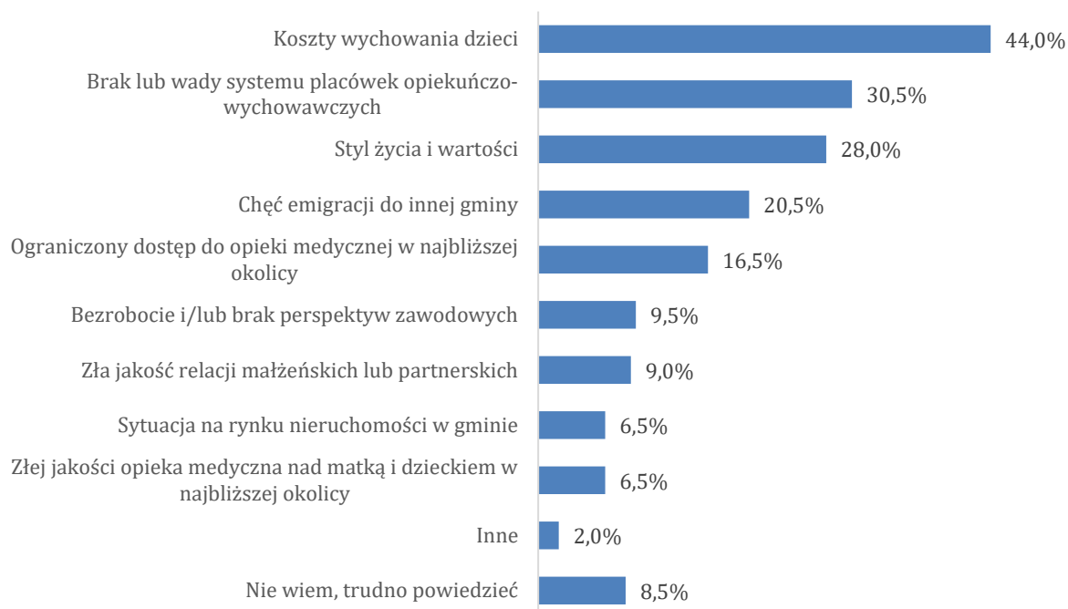
Wykres 2. Co według Pana(-ni) wpływa na brak chęci posiadania dzieci przez mieszkańców gminy Bojszowy?

Większość respondentów była zgodna, że najpoważniejszym problemem dzieci i młodzieży w gminie Bojszowy jest brak zorganizowanych form spędzania czasu wolnego (73,0%) – był to bowiem czynnik wskazywany ponad dwa razy częściej od pozostałych. Mieszkańcy gminy dostrzegają także, że problem tkwi w uzależnieniu dzieci i młodzieży od gier komputerowych lub smartfonów (33,5%), a także braku pozytywnych wzorców i autorytetów (23,5%).