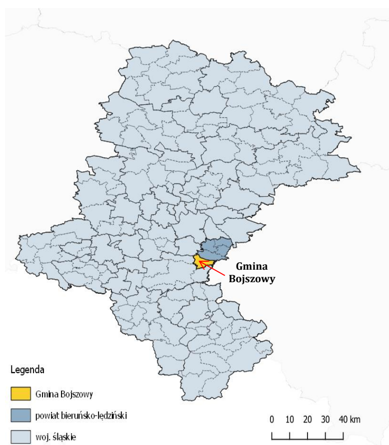
Rysunek 1. Położenie Gminy Bojszowy

Granice między poszczególnymi miejscowościami zacierają się, ponieważ 1 :