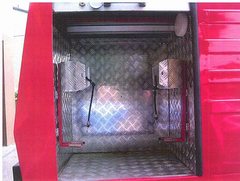
Fot. 13. Pokrywa komory silnika