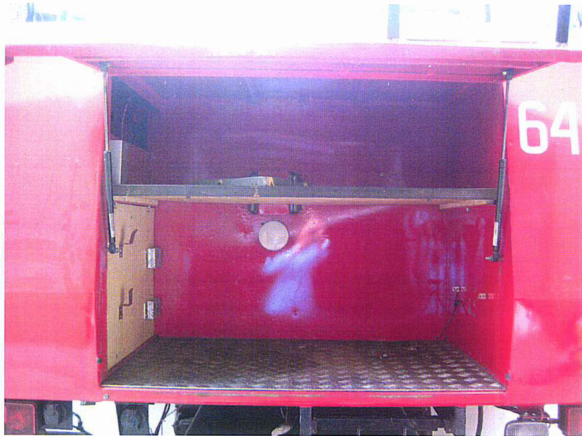
Fot. 14. Schowek tylny wielofunkcyjny