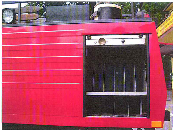
Fot. 16. Schowek na węże gaśnicze \varnothing 52 do dł. 240 [m]