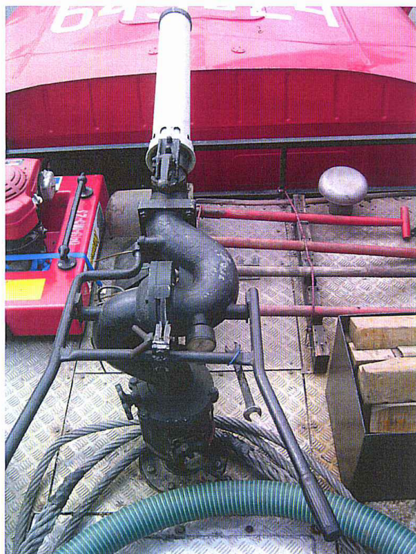
Fot. 17. Działko wodno-pianowe