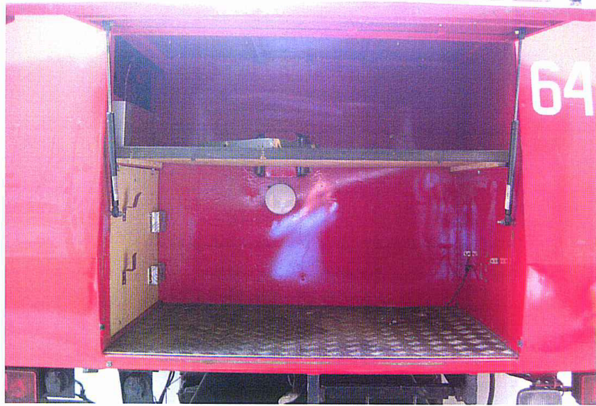
Fot. 14. Schowek tylny wielofunkcyjny