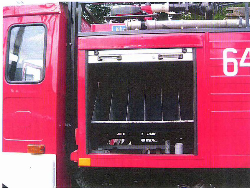
Fot. 15. Schowek na węże gaśnicze \varnothing 75 do dł. 240 [m]