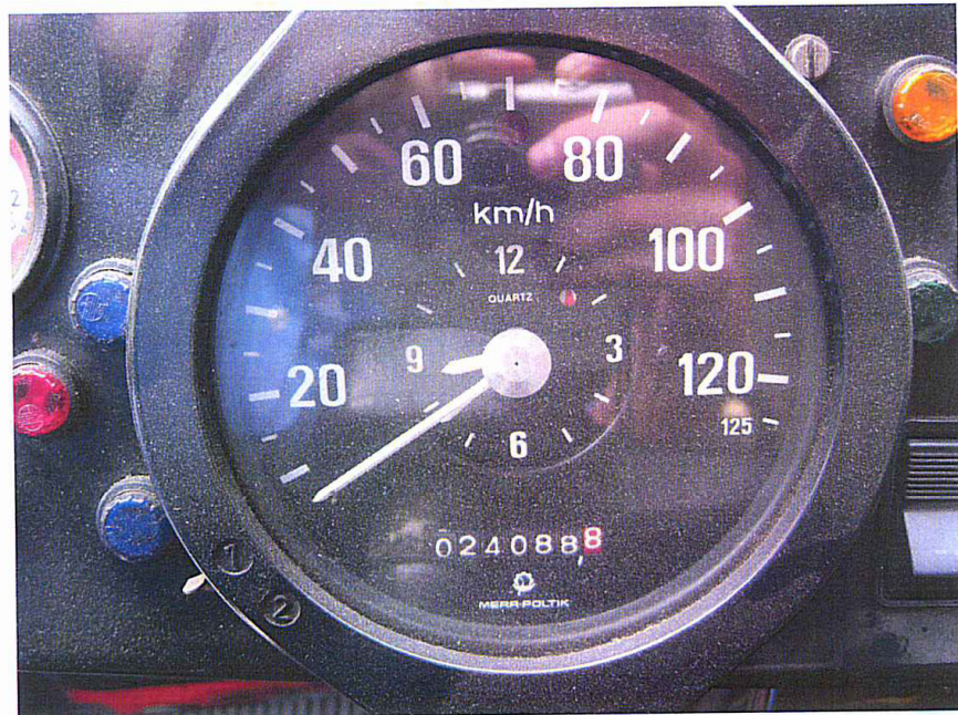
Fot. 10. Stan licznika