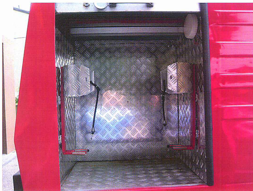
Fot. 13. Pokrywa komory silnika