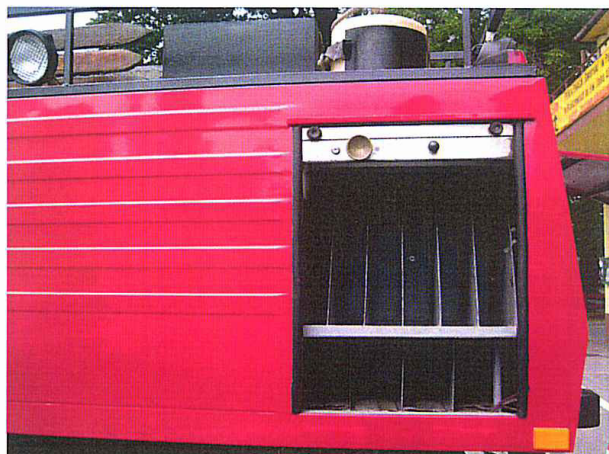
Fot. 16. Schowek na węże gaśnicze \varnothing 52 do dł. 240 [m]