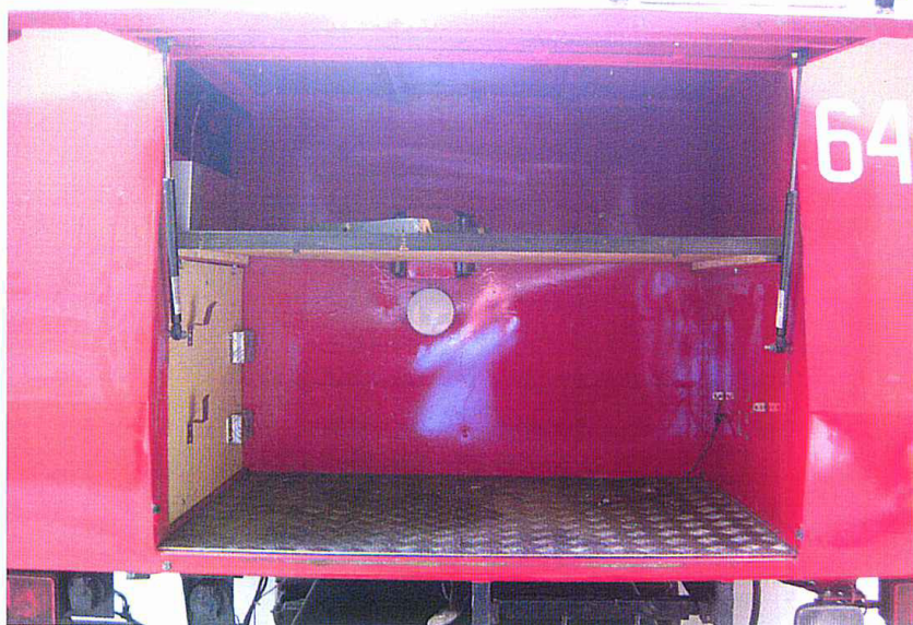
Fot. 14. Schowek tylny wielofunkcyjny